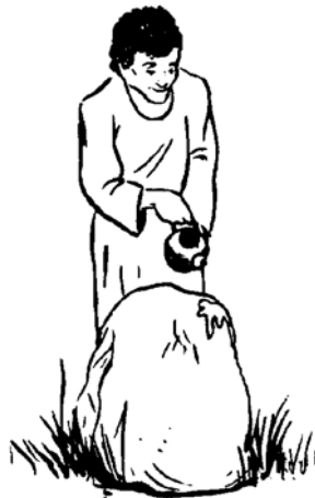
JACOB BATIT UN AUTEL A BETHEL

En considérant la vie de Jacob, nous voyons que le tournant décisif eut lieu à Péniel, lorsque Jacob lutta avec Dieu. Vingt ans s'étaient écoulés depuis le jour où Jacob avait fait un vœu à Dieu à Béthel. Lorsque la lutte entre Dieu et Jacob se termina par un combat en face à face, Dieu changea le nom de Jacob et lui donna le nom d' Israël , qui signifie Prince avec Dieu . L'Éternel donna une nouvelle bénédiction à Jacob (32.24-30). Jacob est resté soumis à Dieu durant le restant de sa vie, même au sein des problèmes et des tragédies (47.9). Dieu a permis à Jacob d'avoir un aperçu de l'avenir et a béni les fils de Joseph (48.13-20) et ses propres fils (49).