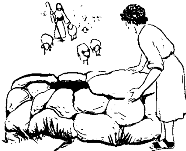
JACOB TRAVAILLAIT POUR LABAN

Jacob a vécu à plusieurs endroits. A Beér-Chéba, il fut un trompeur (28:10). A Hâran, il fut au service de Laban ; il y a été à la fois trompeur et trompé (30.25-43). A Hébron, il est devenu un saint après sa rencontre avec Dieu à Péniel (32.31). A la fin de ses jours, il est devenu un homme respecté et rempli de sagesse en Egypte (46.3-4).