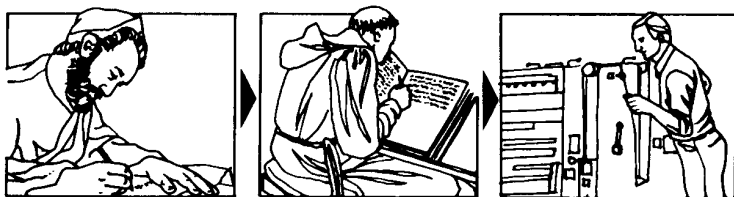
PROTEGEE PAR L'ESPRIT