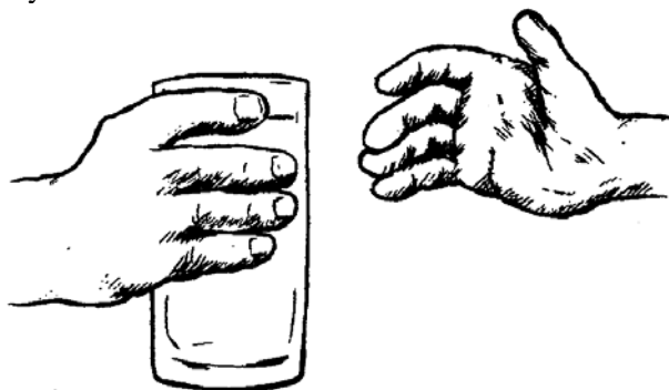
UN SERVICE SPIRITUEL

Se servir les uns les autres peut être un service physique ou matériel, mais il peut inclure le but spirituel de glorifier Christ. Un verre d'eau donné en Son nom est un service spirituel. Christ nous a donné un exemple de service lorsqu'Il a lavé les pieds de Ses disciples. Il a nourri les multitudes avec du pain, au lieu de les renvoyer à vide et affamés.